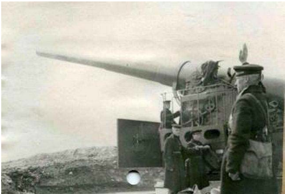
Фото 2. Сержант И.П.Арнаутов дает команду орудийному расчету. май 1942