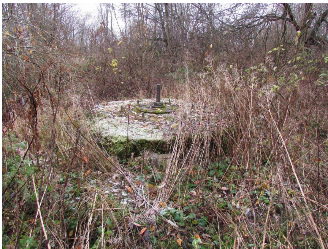
Фотография сделана в ноябре 2020 года