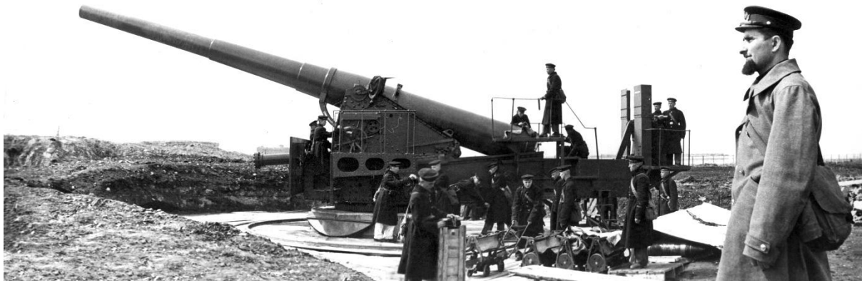
Фото 1. Орудие № 2 665-й батареи. У орудия ст.лейтенант Айлюян С.С.