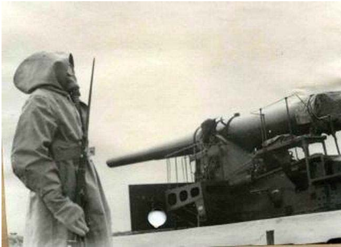
Фото 5. Краснофлотец в противогазе на посту у пушки.