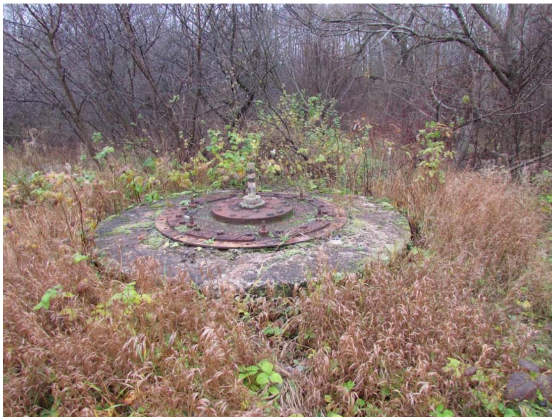
Фотография, сделанная в ноябре 2020 г.