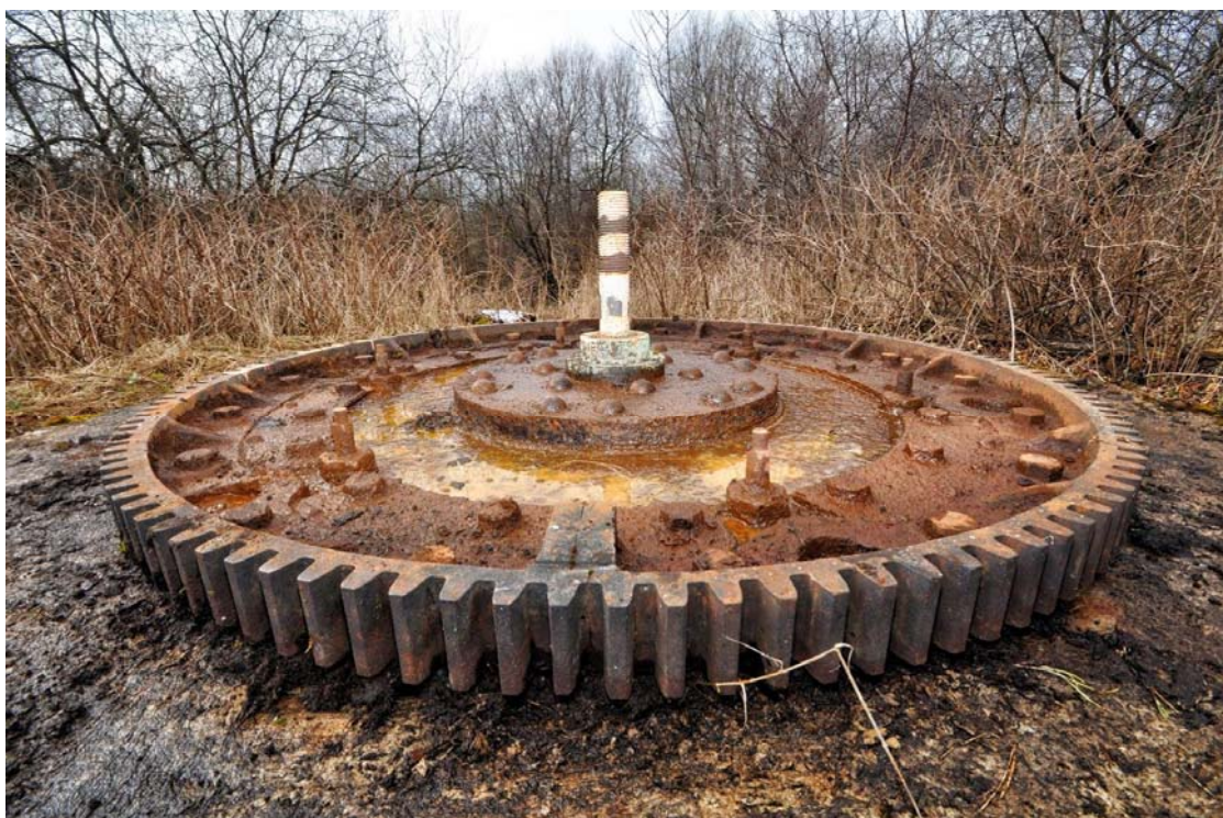
Фотография сделана в 2017 г (за 3 года утрачена шестеренка)