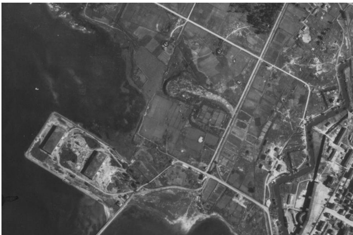
Фото 7. Немецкая аэрофотосъемка 665 батареи 18 июля 1944 г.