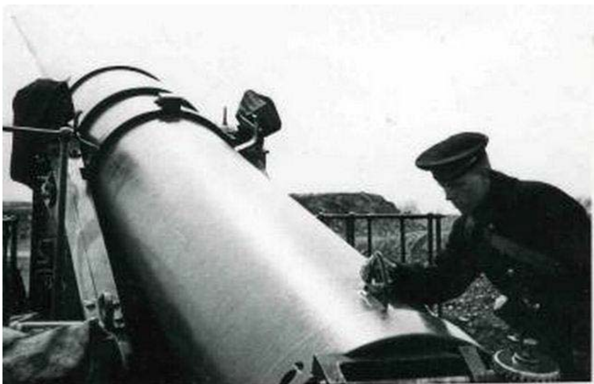
Фото 4 Установщик прицела М.Зосимов