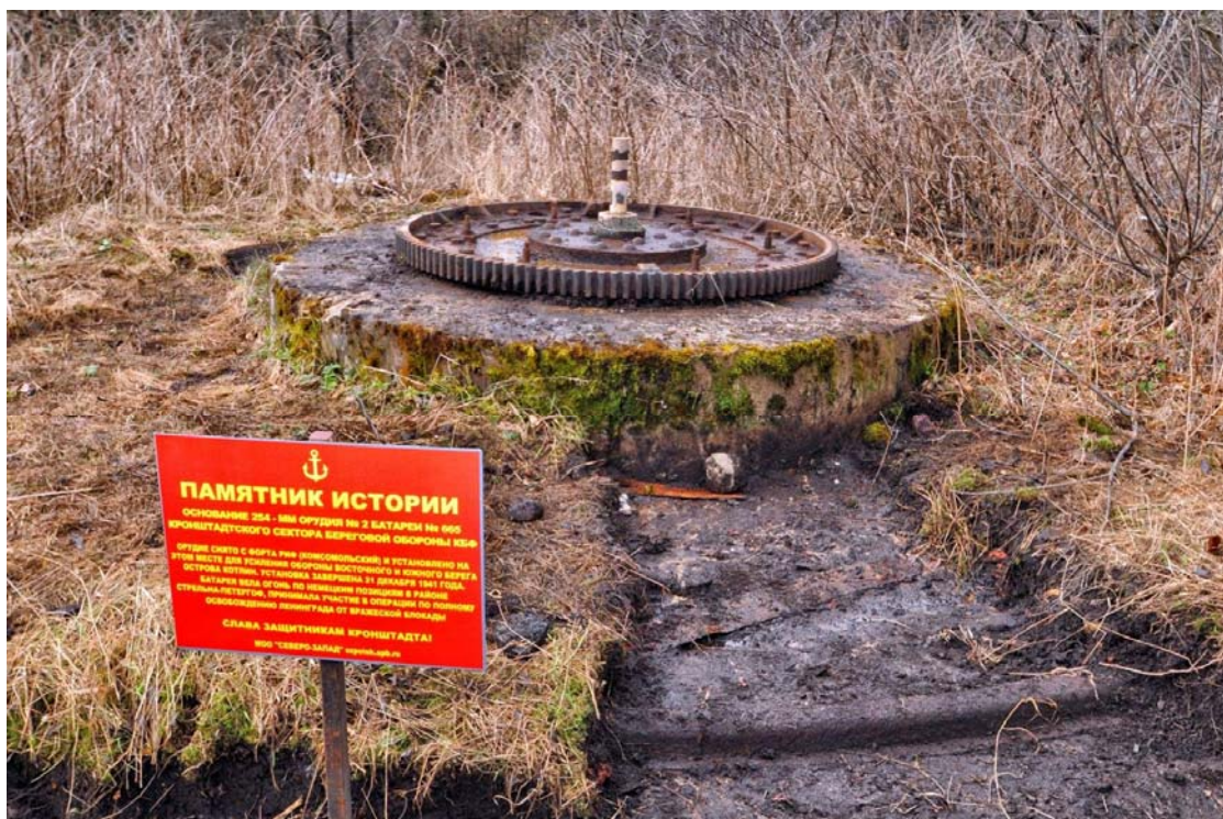
Фотография сделана в ноябре 2017 г. (за три года утрачены шестеренки и рельсы)